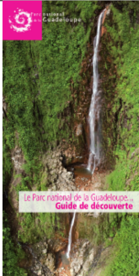
Guide de découverte Parc national de la Guadeloupe